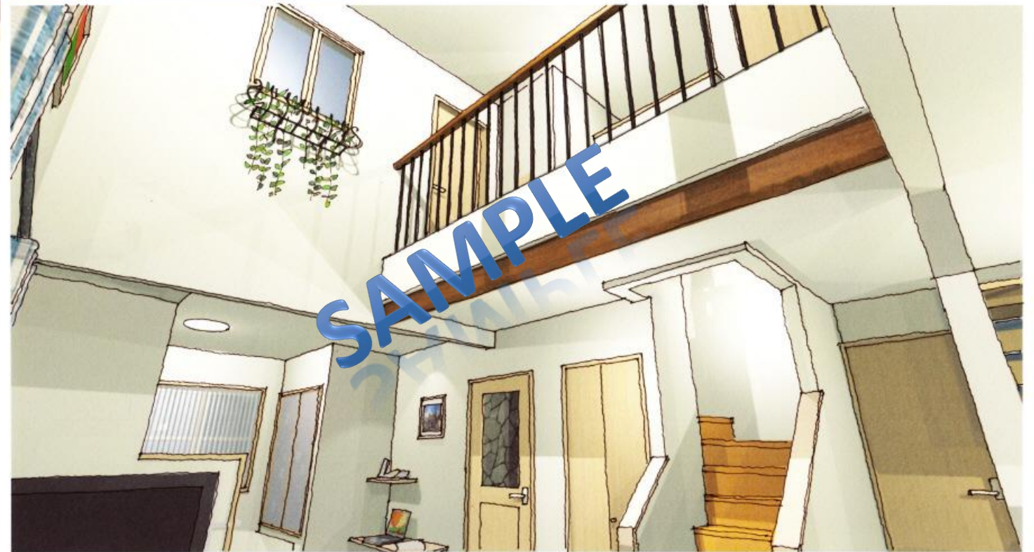
リビングソファから見上げた吹抜のイメージ