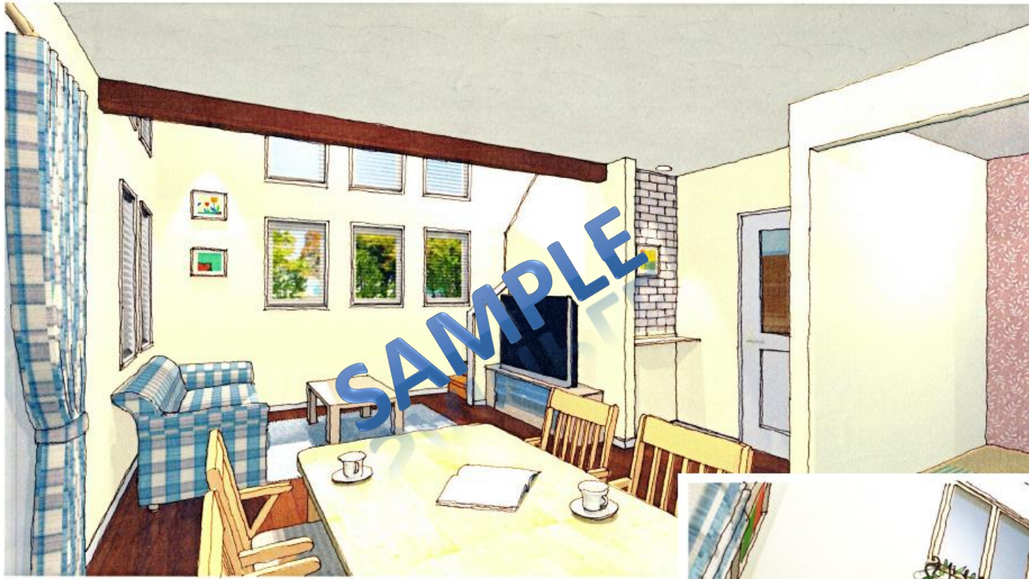
ダイニングからリビングを見たイメージ